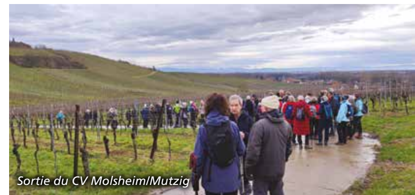
Sortie du CV Molsheim/Mutzig