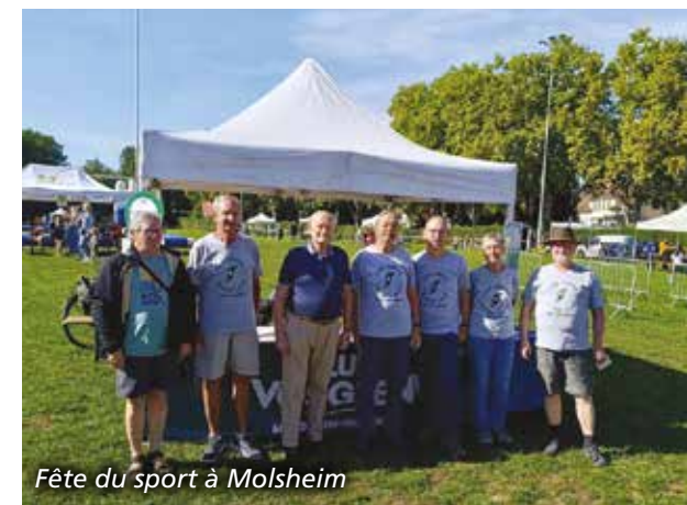
Fête du sport à Molsheim