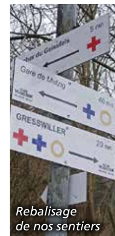
Rebalisage de nos sentiers