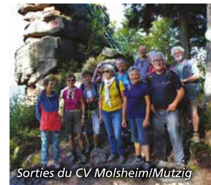
Sorties du CV Molsheim/Mutzig